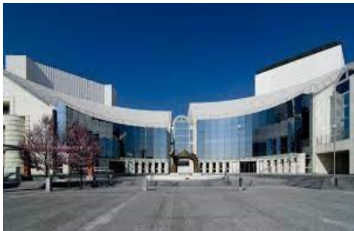
Nová budova SND